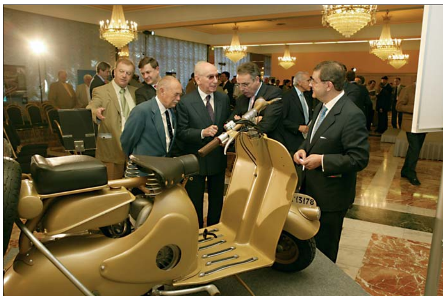
El único modelo de la moto Iruña acapará la atención de los asistentes.

Pocas veces podemos encontrar un ejemplo tan claro de cómo una iniciativa pública, en este caso el Programa de Promoción Industrial, es el instrumento que impulsa una transformación socioeconómica de tal magnitud